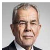
ALEXANDER VAN DER BELLEN

„Europa muss seine Stärken erkennen und in diese investieren. Wir vertrauen auf innovative Hochschulen wie das MCI, um nachhaltige Fortschritte in Wissenschaft, Bildung und Forschung zu erzielen!“